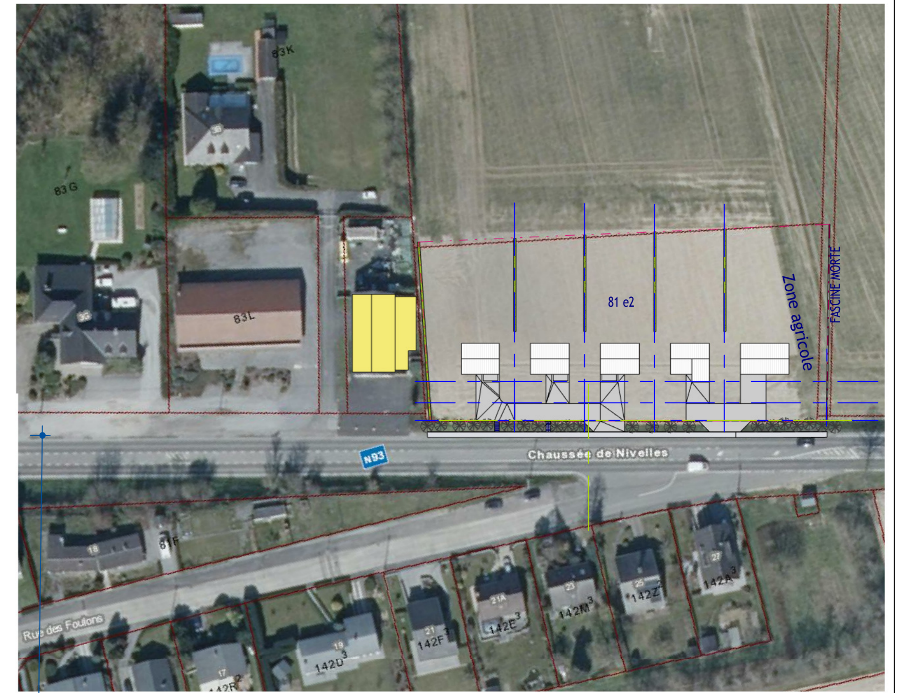
00 IMPL. VUE AERIENNE. Ech : 1 : 1000