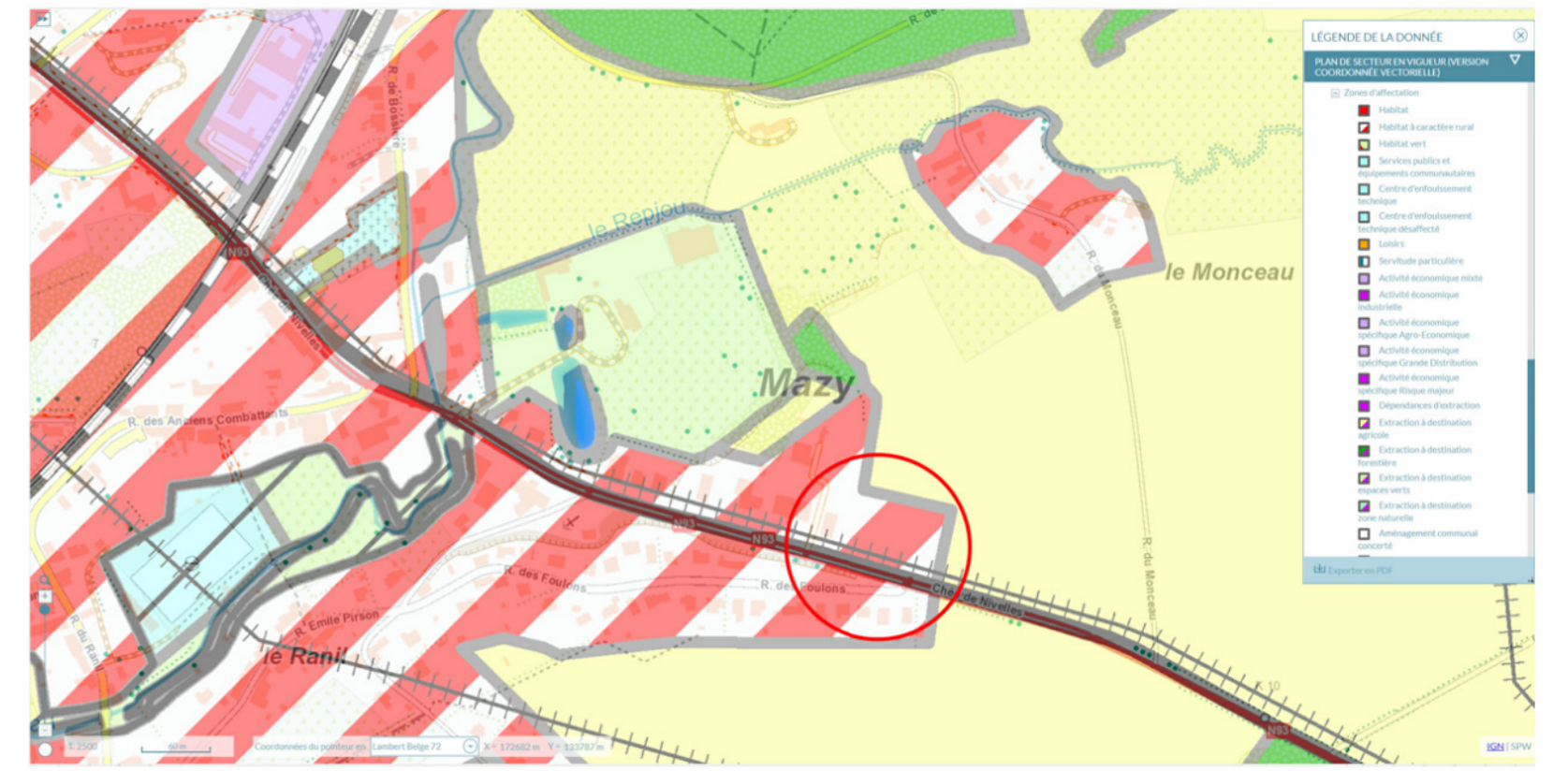
PLAN DE SECTEUR: Terrain en zone d'habitat à caractère rural